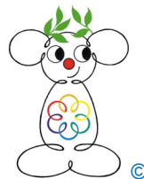
Delphix – Maskottchen