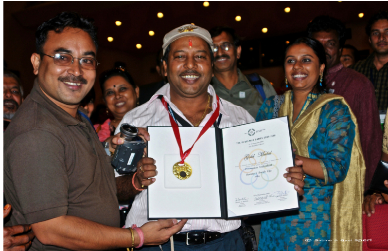
Goldmedaillengewinner der III Delphischen Spiele 2009, Jeju, Korea

Wir leben in einer Zeit , die dominiert wird von Zynismus, Misstrauen, Unsicherheit und Angst. Das Internet kann verbinden, aktivieren und aufklären. Aber auch Fanatiker, Fundamentalisten und populistische Nationalisten verbreiten ihr Gedankengut. Die Flüchtlingskrise droht zu eskalieren, die Probleme von Minoritäten nehmen zu. Migration und Arbeitslosigkeit stellen drängende Fragen. Kriege und lokale Rebellionen schüren Ängste. Menschen sind bereit und willens, die abscheulichsten und gewalttätigsten Verbrechen zu begehen.