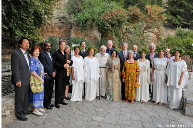
Wasserzeremonie an der Kastalischen Quelle in Delphi, Griechenland; 2015

Das Delphic Art Wall Projekt unter dem MOTTO „ Mal' Dein Bild von Europa “ verbindet Gesellschaften im Interesse zukünftiger Generationen – ein echter Gradmesser für Werte.