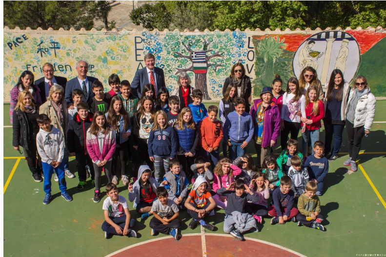
Delphic Art Wall, Grundschule in Delphi, Griechenland; April 2017

Im April 2017 wurde das Delphic Art Wall Projekt in Delphi und Kirra in Griechenland gestartet. Der Auftakt erfolgte mit Unterstützung der Zentralregion Griechenlands und der Internationalen Delphischen Akademie.