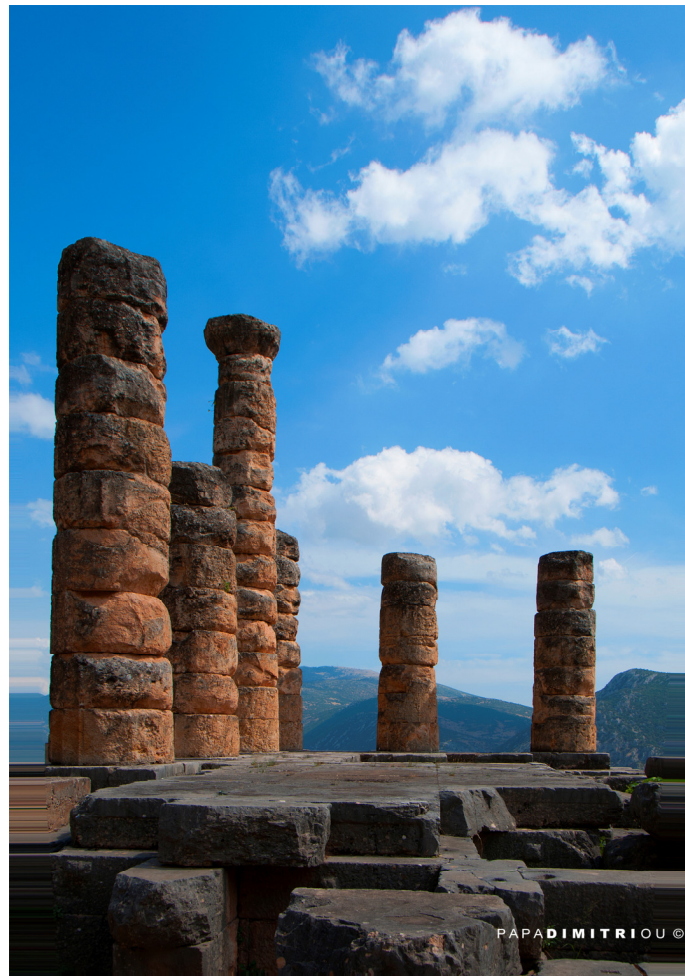
Apollo-Tempel in Delphi, Griechenland