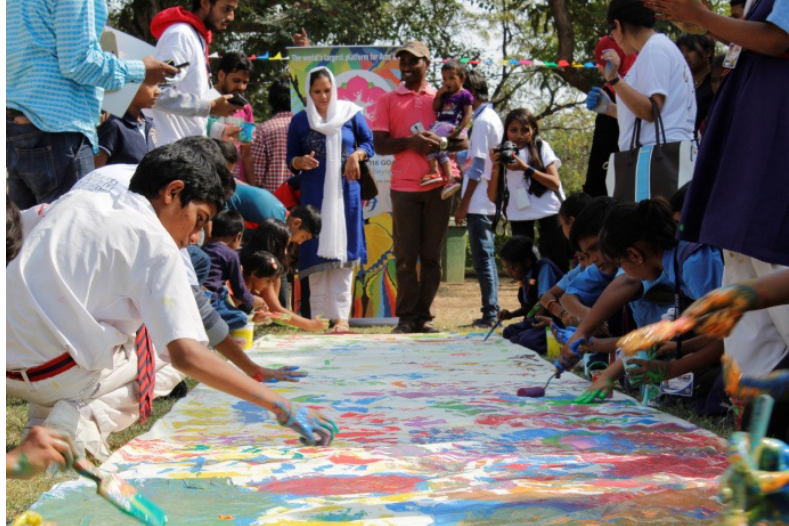
Sanjeeviah Park, Hyderabad, Indien; November 2015

Am ersten Delphic Art Wall Projekt in Hyderabad waren 100 Schulen beteiligt, entstanden sind mehr als 2000 Kunstwerke.