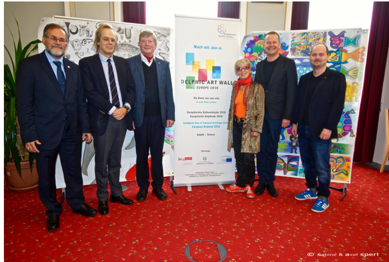
Delphic Art Wall Präsentation in Berlin 2017

Die Auftaktveranstaltung fand am 4. Oktober 2017 statt, in der Bundesakademie für Sicherheitspolitik / Schloss Schönhausen, Berlin-Pankow. Dr. Klaus Lederer, Berliner Bürgermeister und Senator für Kultur und Europa, hat die Schirmherrschaft übernommen.