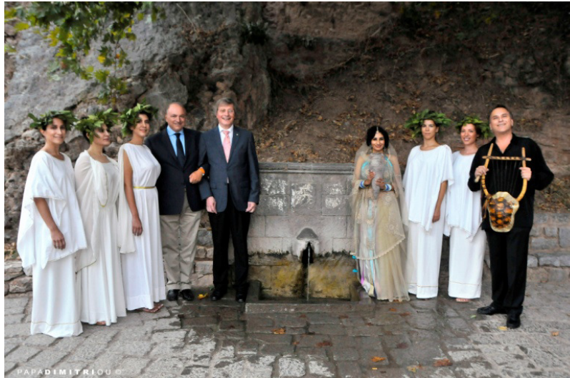
Wasserzeremonie an der Kastalischen Quelle in Delphi, Griechenland 2015

Delphi ist der Geburtsort der Delphischen (Pythischen) Spiele. Die Delphischen Spiele gelten als ein friedensstiftender Wettstreit der Künste. In der Antike wurden sie organisiert von der Amphiktyonie, dem Zusammenschluss der 12 Stämme Griechenlands. Es ging darum, den Frieden zu erhalten und das Heiligtum zu schützen.