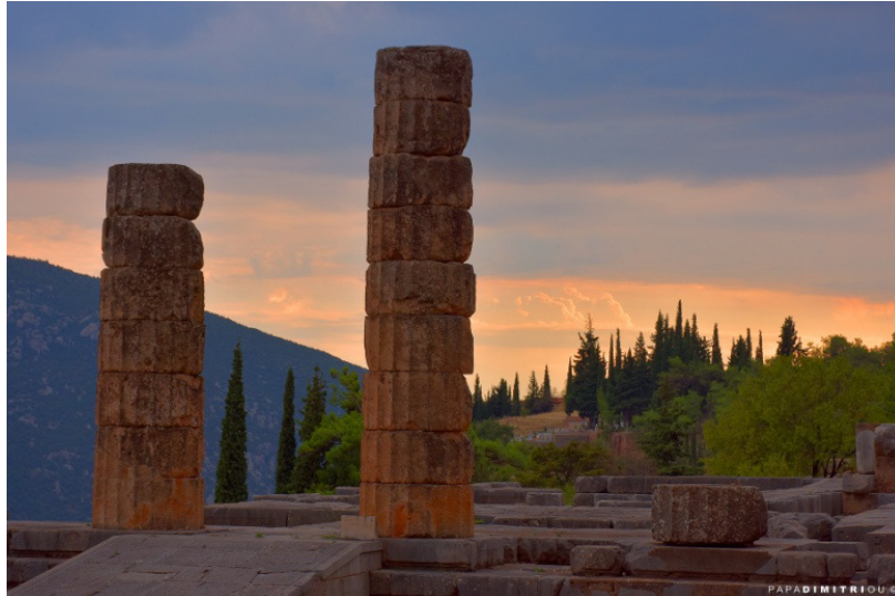
Tempel des Apollon in der archäologischen Anlage in Delphi, Griechenland

Delphi galt den Menschen der Antike als Mittelpunkt der Welt. Hier fanden fast 1000 Jahre lang die Delphischen (Pythischen) Spiele statt – ein friedlicher Wettstreit der Künste. Sie wurden nach drei „Heiligen Kriegen“ von der Amphiktyonie, dem Staatenbund der 12 Stämme Griechenlands, ins Leben gerufen – um den Frieden zu bewahren. Die Amphiktyonie wurde zum Vorläufer der Vereinten Nationen (UN).