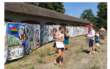
Delphic Art Wall – A wall that unites – 2017 / 2018