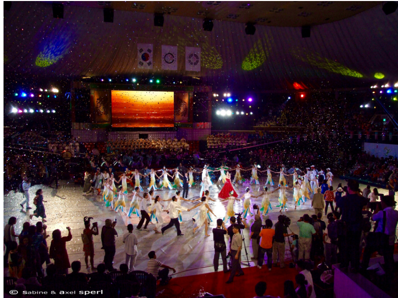
Eröffnungszeremonie der III. Delphischen Spiele 2009, Jeju, Korea

Die Delphischen Spiele sind die weltweite Bühne zur Begegnung der Künste und Kulturen, ähnlich wie die Olympischen Spiele für den Sport. Sie fördern kulturelle Vielfalt, Bildung und kulturelle Verständigung. Sie bilden die gemeinsame Plattform für Künstler, Lehrer, Erzieher, Juroren, Publikum, öffentliche und private Repräsentanten, Sponsoren, Agenten und die Medien.